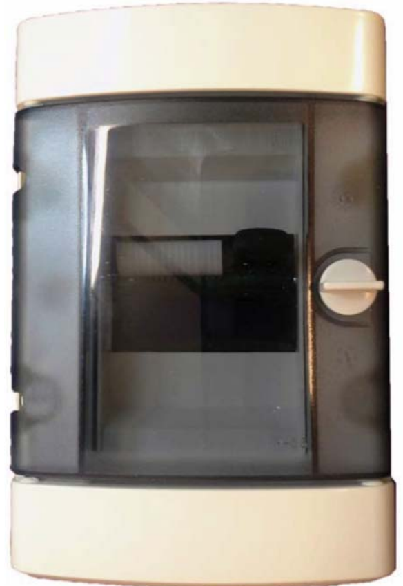
El CloudLink incrementa la eficacia de la transmisión de datos